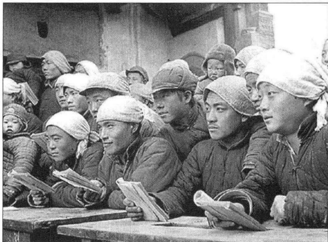
抗战时期的山东冬学运动

纪念抗战胜利70周年,就是要牢记真实的历史,珍爱和平,并以此为契机,通过爱国主义教育增强国家文化软实力。档案工作者和文史工作者,更应以“为党管档,为国守史,为民服务”为己任,积极收集、整理、保管和利用抗战档案,发挥其沟通历史和现实、过去和未来的桥梁作用,展示真实的抗战历史,以各种形式推动党政机关乃至社会大众的爱国主义文化教育浪潮,增强民族凝聚力。□